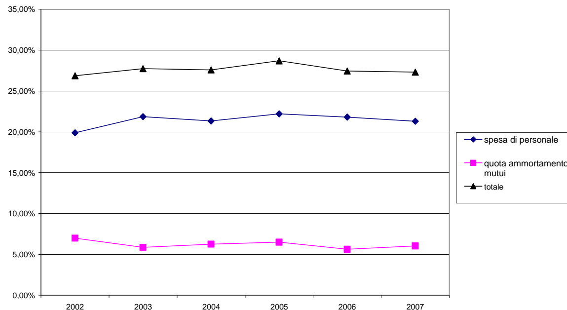
Andamento degli indici finanziari di rigidità

VELOCITA' GESTIONE SPESE CORRENTI - Indica quale parte degli impegni di spesa corrente ha concluso, entro l'esercizio finanziario, il ciclo finanziario con il pagamento. Il 2007 ha registrato una percentuale del 69,90%, riportandosi ai livelli del 2004.